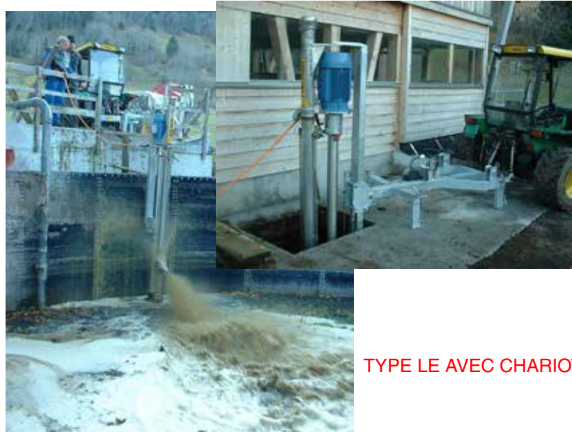
TYPE LE AVEC CHARIOT

Pompe de brassage avec moteur électrique. Débit maximum 5'700 l/mn. Hauteur de pompage, maximum 22 m.