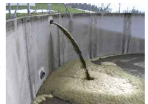
Matière liquide à la sortie du séparateur