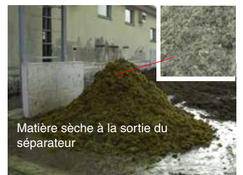
Matière sèche à la sortie du séparateur