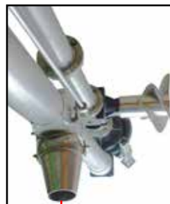
SYSTEME DE BRASSAGE ORIENTABLE

La pompe est actionnée par le tracteur et accrochée au levage hydraulique au moyen d'un chariot sur lequel est fixé un treuil pour l'installation dans la fosse. Pour tracteurs de 80 à 140 CV, diamètre de 120, 150 et 200 mm.