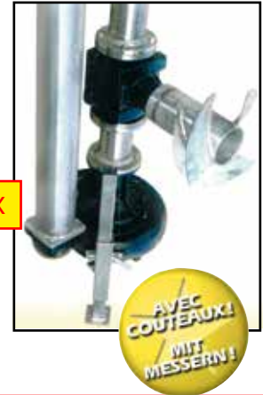
TYPE LEM OU LTM