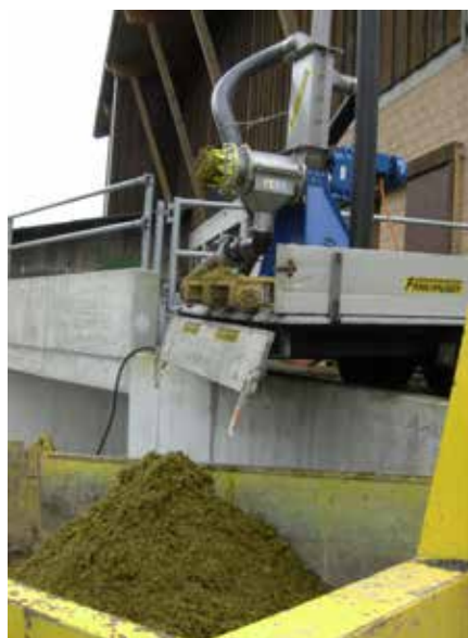
Modèle pour exploitation de petite taille.