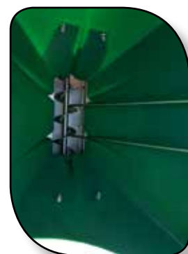
Vis sans fin