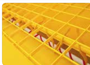
Rotor + vis avec filets à pas inversé