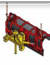
Lame de déneigement SNOWNET 2000