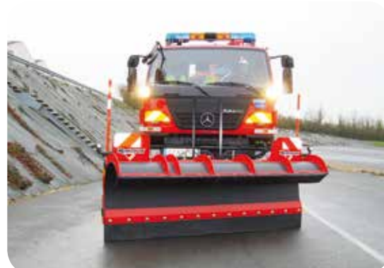
Montage sur plaque SETRA (nous consulter)