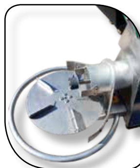
Plateau de distribution