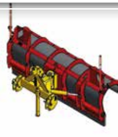
Lame de déneigement SNOWNET 2500