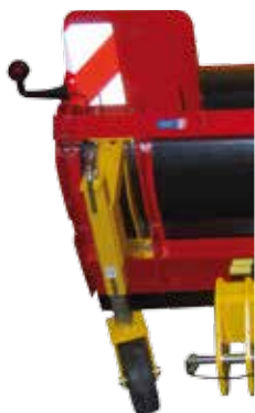
Option roues de terrage réglables par manivelle