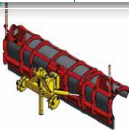
Lame de déneigement SNOWNET 3000