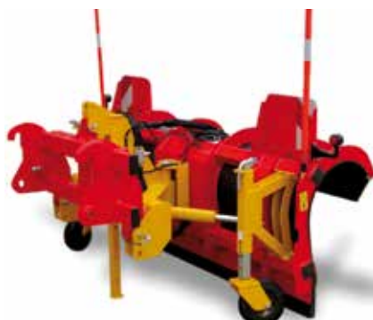
Option interface autre porteur (télescopique, chargeuse...)